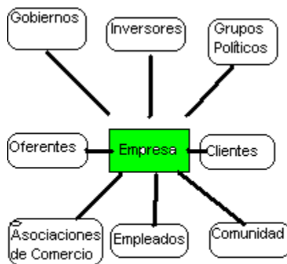
Modelo de Partes Interesadas (Stakeholder)

propiedad privada como lo hicieron Berle y Means, 16 el surgimiento de numerosos grupos de interesados y de nuevas cuestiones estratégicas requiere volver a pensar el esquema tradicional de la empresa (1984, p. 24).